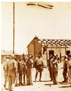
יום העלייה לקרקע ב"סעד-תחתית" - הוא יום ההולדת של הקיבוץ!

לבסוף הצליחה משימת העלייה לקרקע ב"סעד-תחתית" - כיום: "מעוז מול עזה". זה קרה ביום י"ב בתמוז תש"ז- 29 ביוני 1947 ולמחרת התבשר על כך כל היישוב היהודי בארץ בעמודים הראשונים של העיתונים.