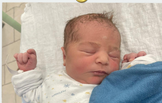
הנסיכה למשפחת מלכה