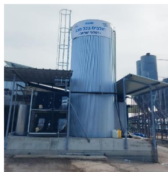
מיכל החלב החדש.

בשבוע הבא יתפרסמו דוחות משקיים נוספים (גד"ש, גזר, מטע וקייטרינג).