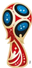
FIFA WORLD CUP

נסו למצוא קשר בין השאלות לפרשת "תולדות", תשובות בעמוד 8