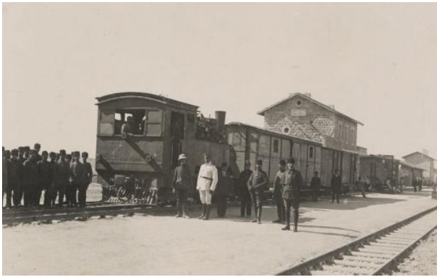
צילום הסטורי משנת 1915 של תחנת הרכבת בבאר שבע שהוקמה בתקופה העותמנית

עֲלֵת בּוֹנוֹס: מִי הַמַּשְׁפּוּחַ שֶׁאֵרֶת בְּקִצֵּה אֲרֵצֵת רֹחוֹת הַשָּׁמַיִם בְּקִיבוֹץ? (הֵכִי צְפוֹנִיִּים, וְכו')