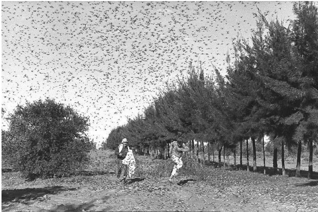
הארבה מכה בסעד

קטעים מן הארכיון: ריאיון עם ברוך ניר ז"ל ויחזקאל זוהר (סומברה) ז"ל