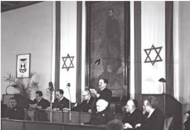
ישיבת הפתיחה של האספה המכוננת ט"ו בשבט תש"ט, 14 בפברואר 1949

נתן אלתרמן, ה"טור השביעי", עיתון 'דבר' - (פברואר 1949)