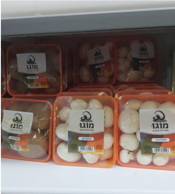
הפטריות בכלבו.

חיבר: אריאל אפאלו, מעיח הכשרות של "מואו", לכבוד טובה של חברת "מואו" שלנו לפצילות. בשעה טובה!