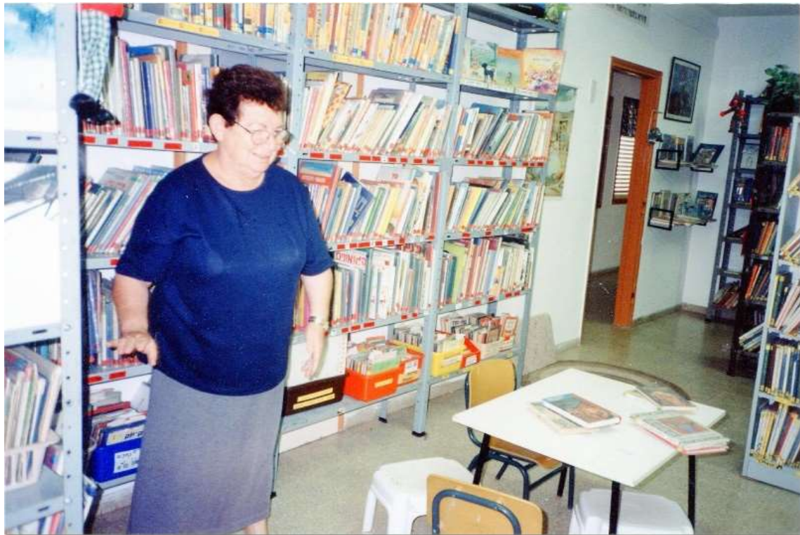
תמונה של ציפי ז"ל בממלכתה, ספריית הילדים, תשנ"ח 1998. מתוך 'סיפור מקומי'.