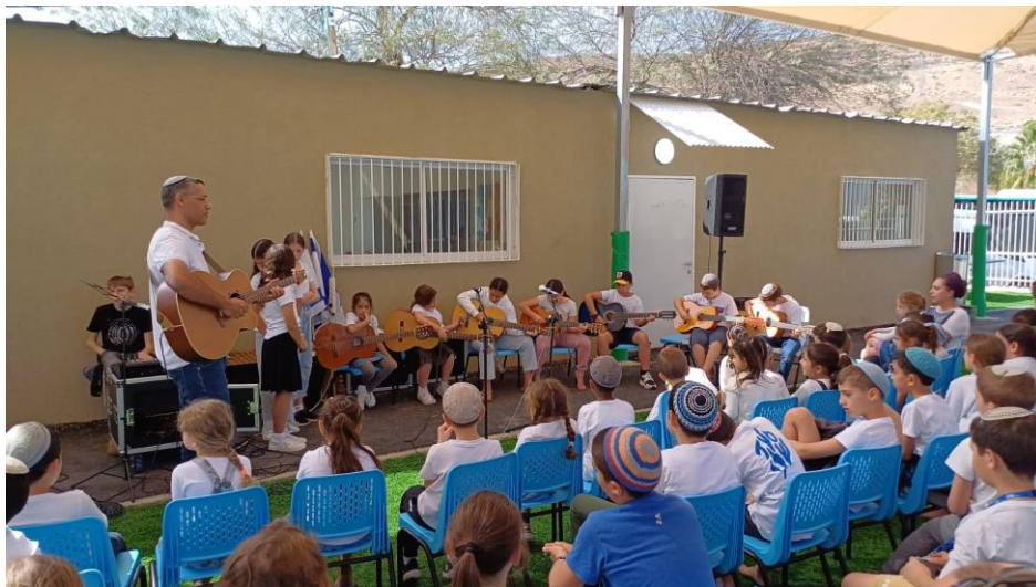
מתוך הטקסט.